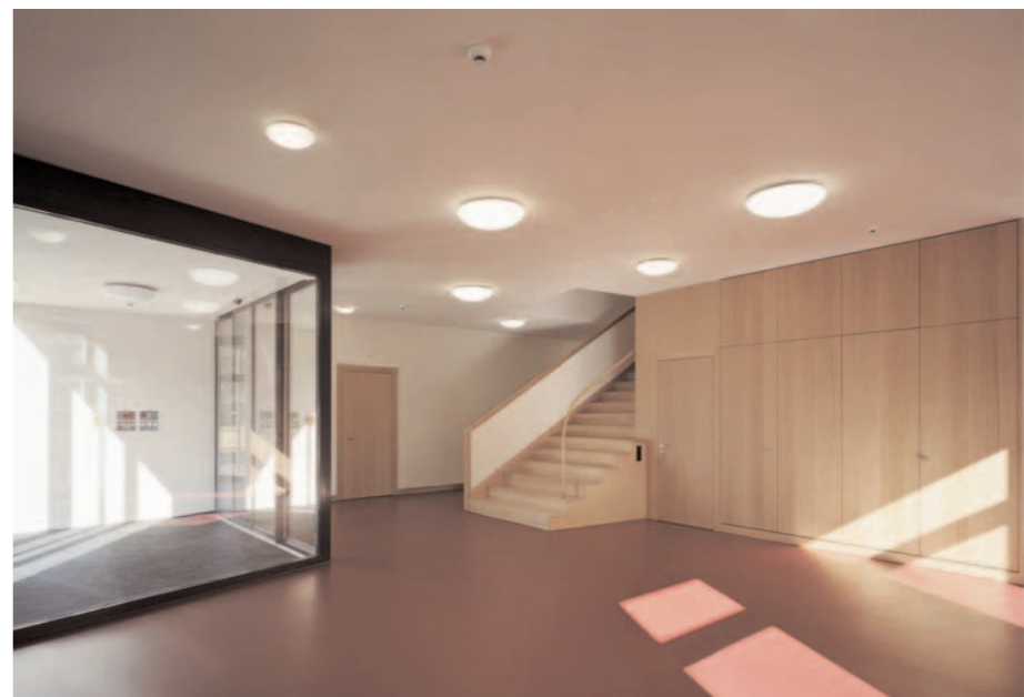
Blick in den Vorraum einer Wohngruppe.

Diese Baureportage konnte dank freundlicher Unterstützung unserer Baupartner realisiert werden.