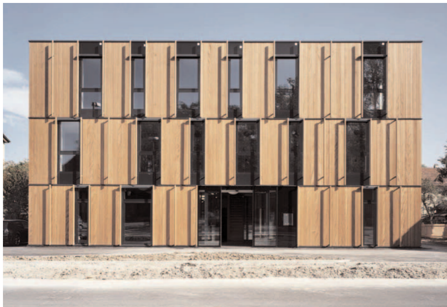
Eingangseite des neuen Wohnhauses an der Eichwaldstrasse.